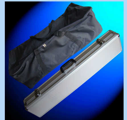
Sac de la structure et valise kit d'éclairage