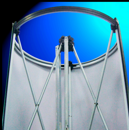
3 barres cintrées hautes et basses

Une Colonne cylindrique (lumineuse ou non) qui tient dans un sac et qui utilise le même type de structure tubulaire que le célèbre Stand Classic Pop'up, même hauteur : 2,30 m !