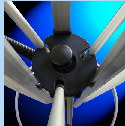
4 liaisons centrales