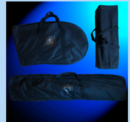
3 Sacs inclus