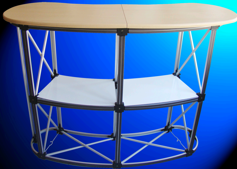
Comptoir Classic Pop'up monté sans visuel