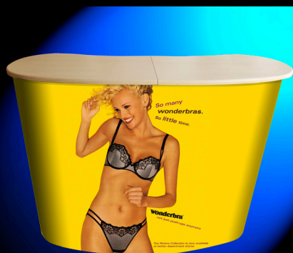
Comptoir Classic Pop'up avec visuel