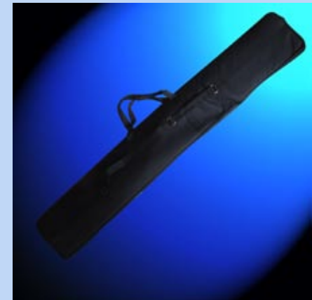
Sac de transport inclus