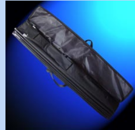
Sac à compartiments