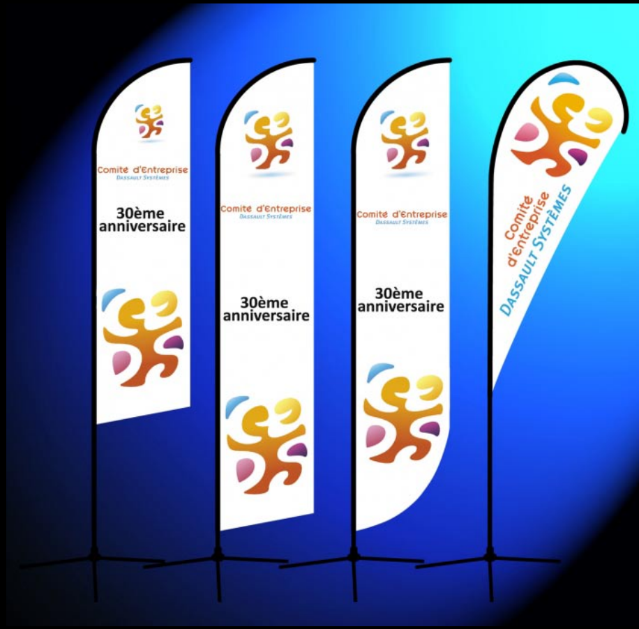
Flying facile à ranger dans un sac grâce à son pied rétractable